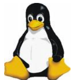
Tux de mascotte

Ubuntu is ook nog de naam van een compleet en gratis Linux besturingssysteem, vrij beschikbaar en gratis van het Internet af te halen. Ubuntu wordt ontwikkeld door een grote groep mensen, computernerds, maar ook mensen zoals jij en ik.